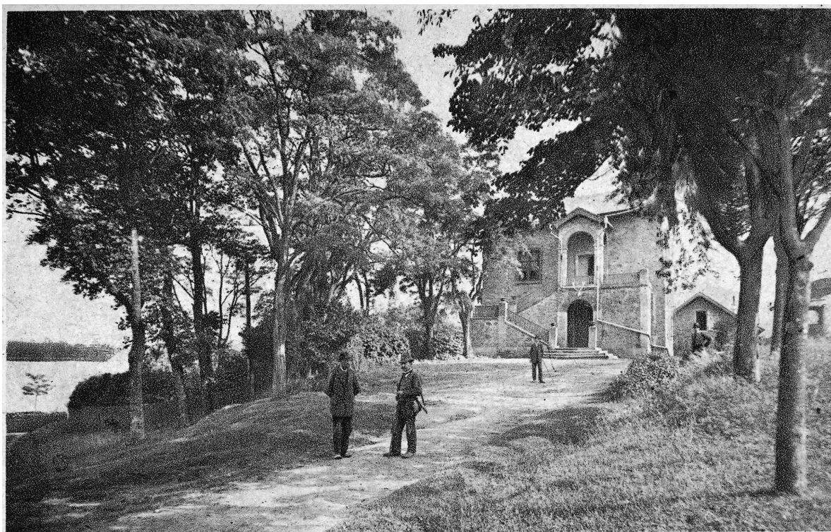
Pohlednice po r. 1918, edice F. Kocman, Jedovnice.

Dnešní stav: Detail balkonu na východní straně hlavní budovy, vpravo rozmístění budov lesovny (u krátké příjezdové cesty vedoucí na jih) v okolní zástavbě (letecký snímek z www.mapy.cz ). Lesovna leží u krátké příjezdové cesty odbočující z komunikace jižním směrem.